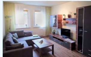
Konzept, Text und Gestaltung: www.metronom-leipzig.de

Sie benötigen eine Unterkunft für Ihre Gäste oder planen selbst eine Reise nach Oschersleben? Wir haben die perfekte Lösung: Unsere modernen und stilvoll eingerichteten Gästewohnungen bieten höchsten Wohnkomfort zum kleinen Preis.